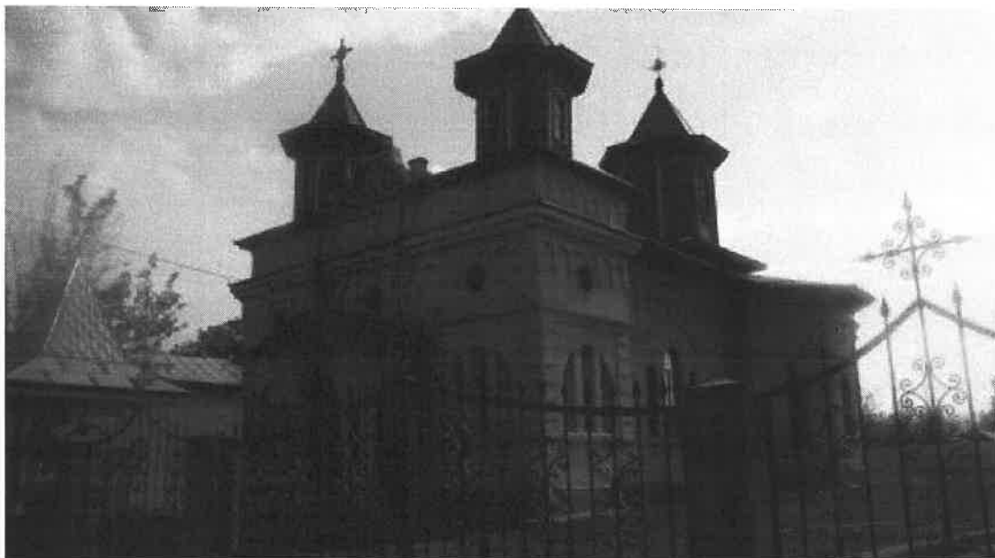
Biserica „Sf Ierarh Nicolae”