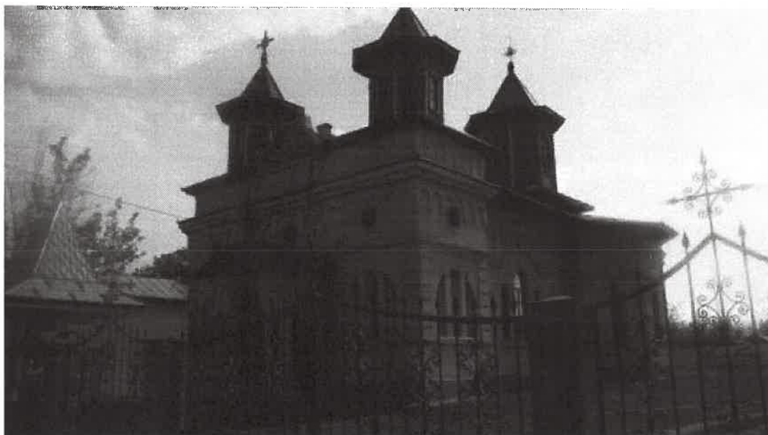
Biserica „Sf Ierarh Nicolae”